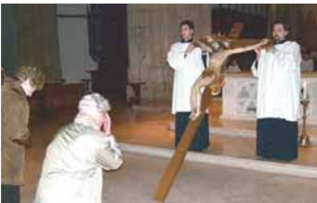
Karfreitag - Kreuzverehrung