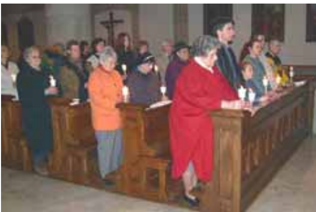
Osternacht – Tauferneuerung