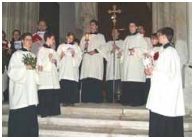
Osternacht – Osterfeier vor der Kirche

Rechtzeitig zur Karwoche konnte das Bild wieder an seinen Platz zurückkehren. Ein großes „Danke“ der Pfarrgemeinde konnte der Pfarrer der Restauratorin persönlich übermitteln.