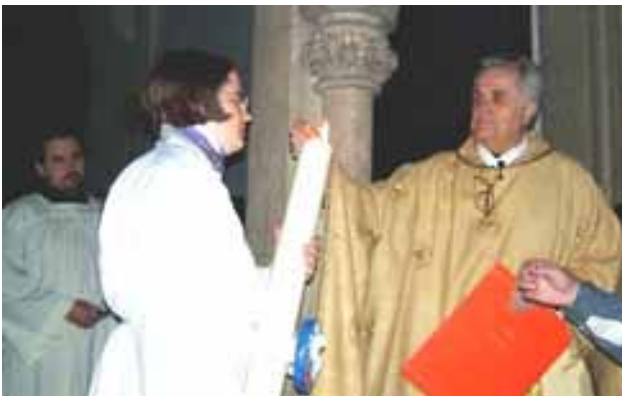
Osternacht – Entzünden der Osterkerze