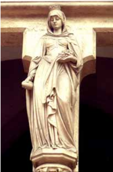
Elisabeth von Thüringen

Die Heilige heiratet schon im Alter von 14 Jahren (!) ihren Mann, Landgraf Ludwig den IV. von Thüringen. Trotzdem war die Ehe sehr glücklich und die beiden freuten sich über drei Kinder. Dann zog Ludwig mit seinem Kaiser, Friedrich II., auf einen Kreuzzug, dabei starb er in Italien, sechs Jahre nach ihrer Hochzeit.